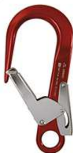
карабин монтажный дюраль