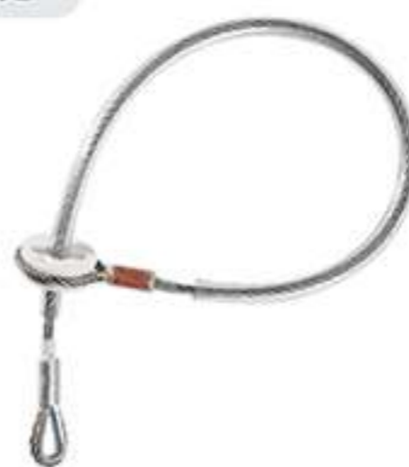
анкерное устройство C10E