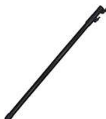
Штанга телескопическая стеклопластиковая