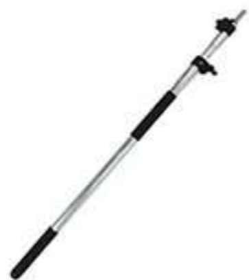
Штанга телескопическая дюралюминиевая